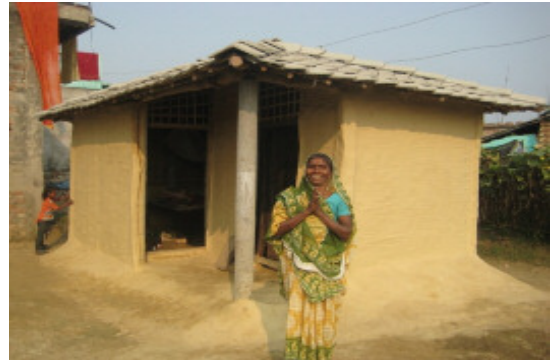
シヤナクプール家屋修繕後