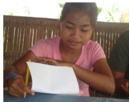
フィリピンの奨学生