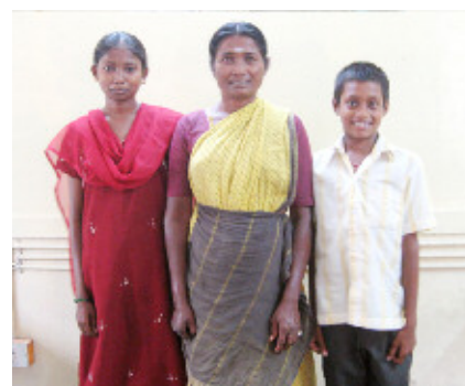
インド南部回復者家族