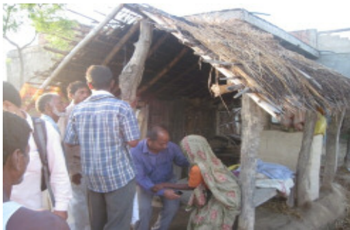
シヤナクプール家屋修繕前