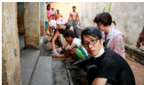
家屋修繕作業の様子