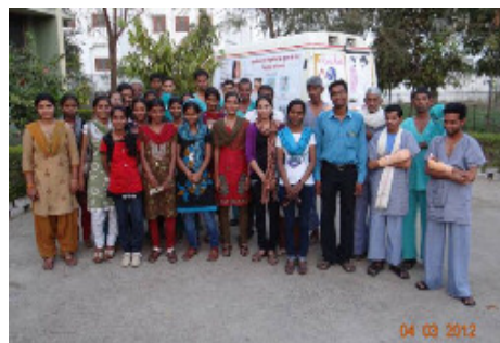
ビハール州の大学生