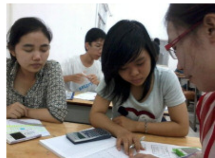
ベトナムの奨学生