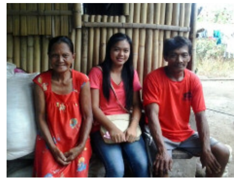
フィリピン イロコスの大学生