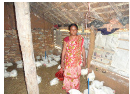
援助で建てた鶏舎