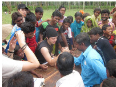
コロニー住民とのふれあいの時間